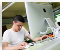
Desenv. productes audiovisuals Certificat professionalitat niv. 3 Inici: 01-03-2021 Final: 04-10-2021 Durada: 560 hores - MATI Requisits acadèmics: Batillerat

Els cursos de formació professional per a l'ocupació són programes formatius teòric - pràctics que tenen per finalitat millorar la qualificació professional i/o la capacitat d'insersió laboral mitjançant l'assoliment i el perfeccionament de les competències professionals. S'adrecen a persones treballadores en situació d'atur.