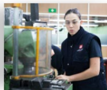
Fabricació Mecànica Certificat professionalitat niv. 1 Inici: 10-03-2021 Final: 08-10-2021 Durada: 480 hores - TARDA Requisits acadèmics: Primària