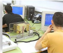
AUTÒMATS PROGRAMABLES I Inici: 24-04-2019 Final: 29-05-2019 Durada: 60 hores de dilluns a dijous Preu: Subvencionat 100%