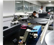
AUTÒMATS PROGRAMABLES II Inici: 03-06-2019 Final: 03-07-2019 Durada: 60 hores de dilluns a dijous Preu: Subvencionat 100%