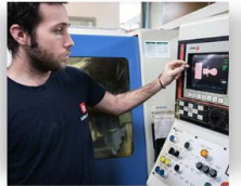
CONTROL NUMÈRIC - FRESADORA Inici: 12-03-2019 Final: 03-04-2019 Durada: 40 hores de dilluns a dijous Preu: Subvencionat 100%