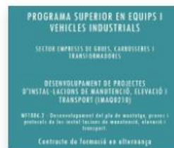
Programa Superior en Equips i Vehicles Industrials (Contracte de formació en alternança):

Certificat professionalitat niv. 2 Inici: 12-05-2024 Final: 19-12-2024 Durada formació: 290 hores - TARDA Requisits acadèmics: ESO Pràctiques a l'empresa: 6 mesos, 8h/dia Inscripció: Oberta fins al 6-09-2024