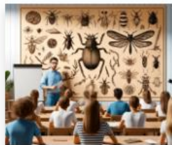
Serveis per al control de plagues (Programa Forma i Insereix)

Certificat professionalitat niv. 2 Inici: 29-01-2024 Final: 28-06-2024 Durada: 570 hores - TARDA Requisits acadèmics: ESO Pràctiques a l'empresa: 80 hores Inscripció: Oberta, fins al 19-01-2024