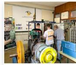
Instal·lacions manteniment Ascensors (Programa FPODUAL):

Mòdul Formatiu de Certificat professionalitat niv. 3 Inici: 10-06-2024 Final: 24-10-2024 Durada: 168 hores - MATI Requisits acadèmics: estudiant o títol GS Pràctiques a l'empresa: 312 hores, 4h o 8h/dia Inscripció i assignació empresa: 29-04-24 a 04-06-24