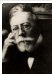
Àngel Guimerà (1845-1924)

A nivell internacional, se celebraran els actes del centenari de la mort de Franz Kafka , autor de la mítica La metamorfosi . El 2024 marca també el centenari del naixement de Truman Capote , un dels autors més rellevants de la literatura nordamericana del segle XX i autor de A sang freda , considerada una obra mestra del "true crime".