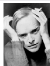
Truman Capote (1924-1984)